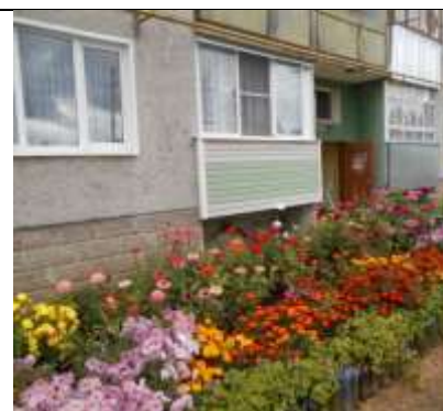
МКД № 7 ул. Зеленая, с. Липовая Роща