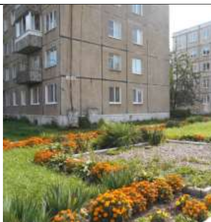
Цветник МКД № 28 ул. Р. Люксембург, г. Гаврилов Посад – городской цветник