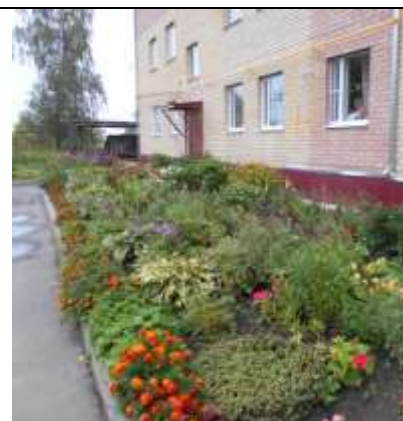
МКД № 6 ул. Школьная, п. Петровский