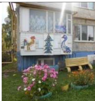
МКД с. Осановец (Ляшенко Т.В.)