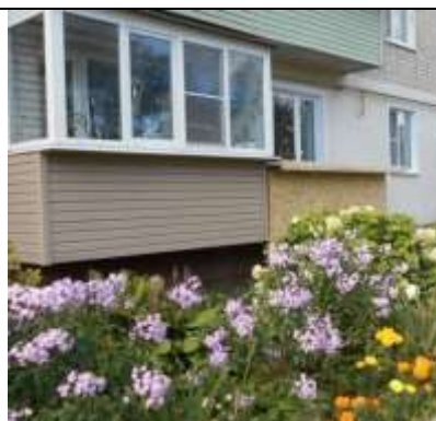
МКД № 22, 1-й Шушинский пер., г. Гаврилов Посад