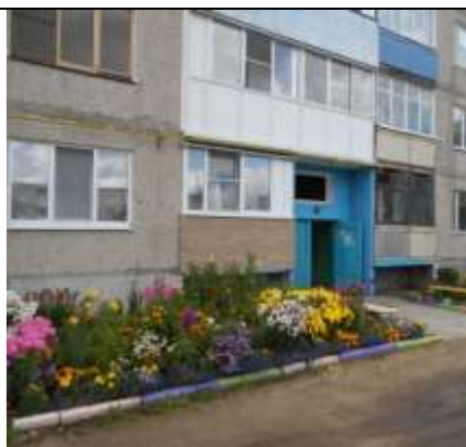
МКД № 4 ул. пл.70 лет Октября, с. Липовая Роща